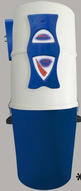
Dual S *